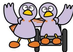
埼玉県のマスコット コバトン